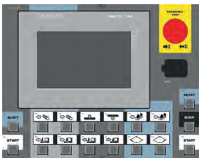
CONTROL PANEL: SIEMENS (X-CNC)